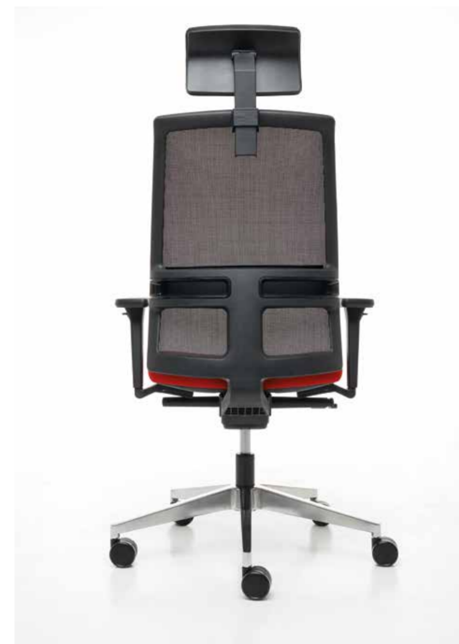
01 PT omnia

Una seduta operativa ideale per ambienti di lavoro innovativi.