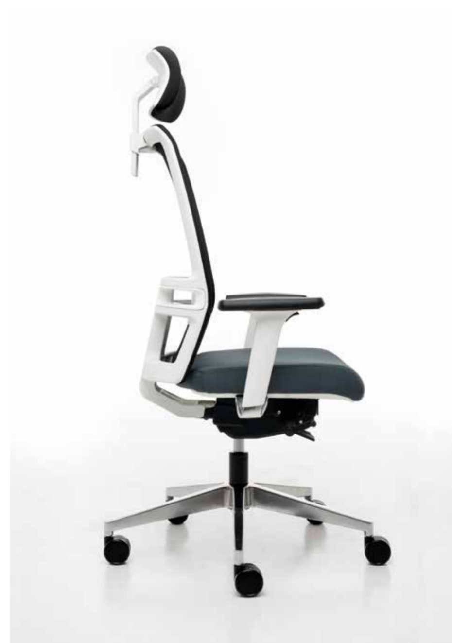
01 PT omniawhite